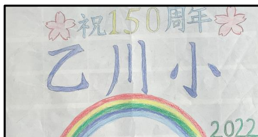
航空写真デザイン

※一部変則的な日程になってはいますが、それぞれの取組をよりよく行うための対応となります。どうかご理解、ご協力をいただきますよう、お願いいたします。