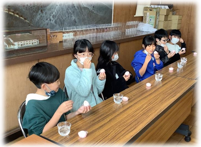
児童による試食・最終決定