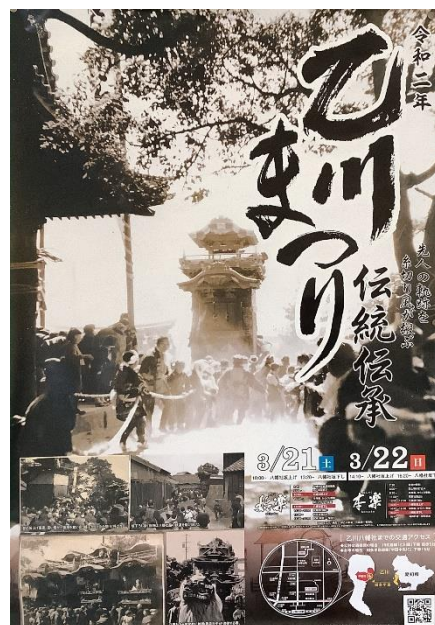
令和2年の乙川まつりポスター

午前中で行う予定です。全学年でお囃子を聞き、学年(学級)毎に山車・神楽獅子と記念写真を撮ります。1・2年生は体育館で和楽器に触れ、演奏する体験を、3年生～6年生は運動場で山車の見学および引く体験を行います。保護者のみなさまにも、子どもたちの活動を見ていただくスペースを作る予定です。ぜひ子どもたちの活動をご覧いただければと思います。詳しい内容は、1月のおたよりでお知らせします。