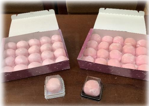
八幡屋さんによる試作商品