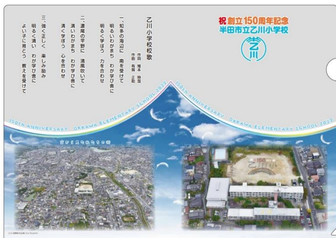
クリアファイル見本