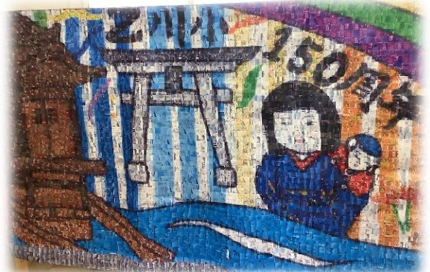
150周年記念モザイクアート

使用した写真は、6年生の児童ひとりひとりが、奈良・京都および乙川それぞれの土地の「よさを感じるもの」「安心できるもの」といったテーマで撮影したものです。この2つのモザイクアートはパネルにして、150周年記念および卒業記念として校内に掲示する予定です。