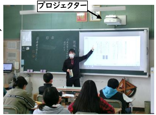
【プロジェクターを使った授業】

今回、半田市内の1~3年生の教室に、黒板の上から壁面に投影できるプロジェクターが設置されました。パソコンをつないで大スクリーンで視覚的な学習が展開できます。今後一人1台のタブレット(ipad)も納入され、来年度から子どもたちの学習ツールとして活用していきます。